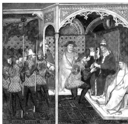
/A lombard városok követei a pápánál/