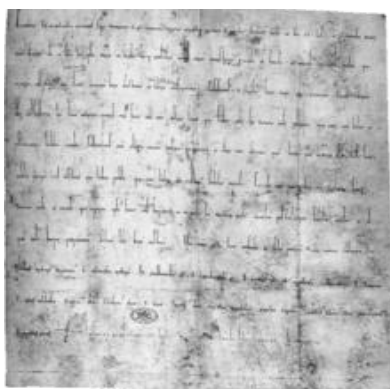
/A wormsi konkordátum egyik példánya/