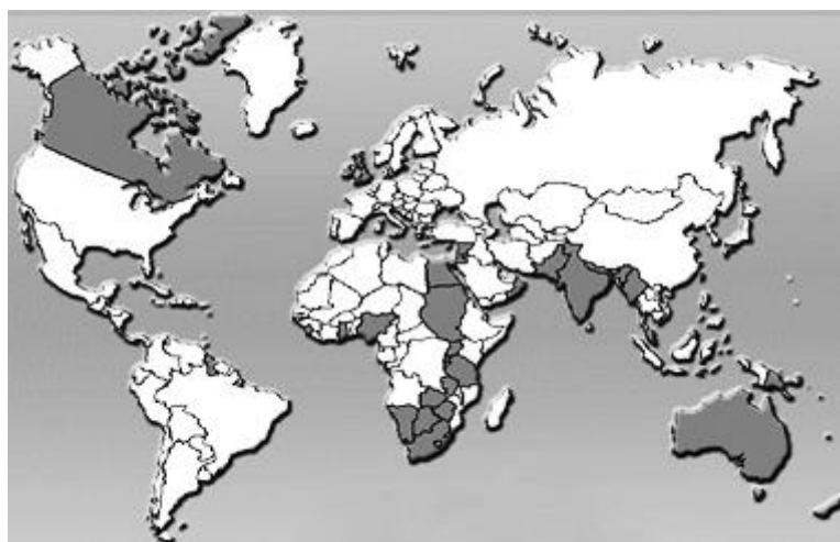
A XVIII. századi világ gyarmati felosztása