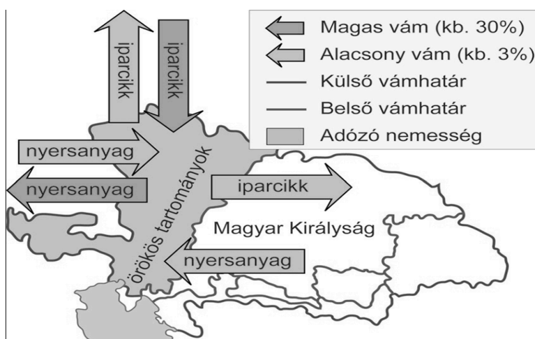
A Magyar Királyság és az örökös tartományok kereskedelmi kapcsolata

"[...] minden Parasztokat, akár mely nevezet és vallásbéliek légyenek, jövőre magok személyekre nézve lakásokat szabadosan változtatható emberekké teszük, és mindenütt olyanoknak tartani parantsoljuk, maga a Természet Törvénye és a köz Jó azt kívánván. [...] Azt akarjuk, hogy minden Parasztnak szabad legyen maga kedve szerint, Földös Úrnak engedelme nélkül is házasodni, Tudományoknak és Mesterségeknek tanulásra magát adni, s azokat akárhol gyakorolni. Minden paraszt ember maga ingó Javait és Keresményit, [...] szabadon eladhattya [...] mind azok a terhek, mellyekkel az el adó, vagy testáló Paraszt ember az ilyen fundusokról [telekről] tartozott, a Vévőre, vagy arra, aki azoknak birodalmába menyen, által szállyanak." / II. József jobbágyrendeletéből/